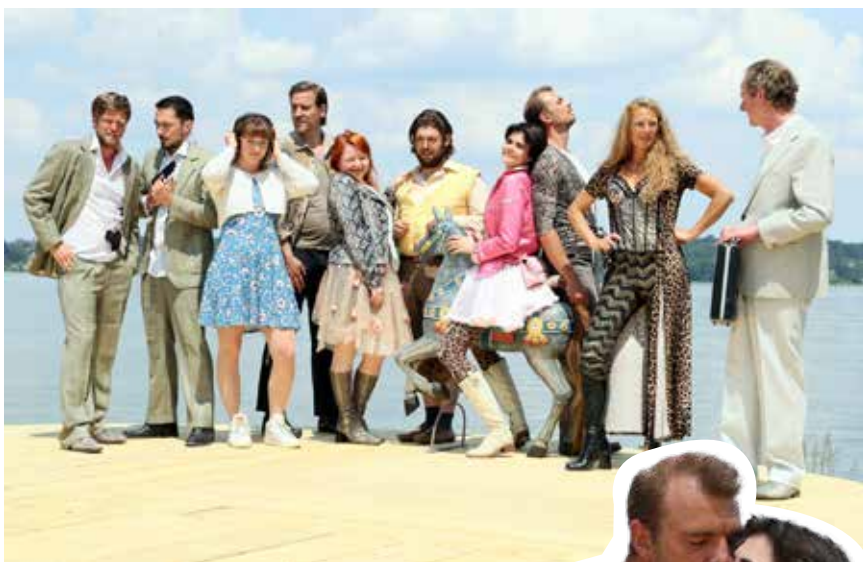
LILIO-ENSEMBLE AUF DER BÜHNE AM BODENSEEUFER