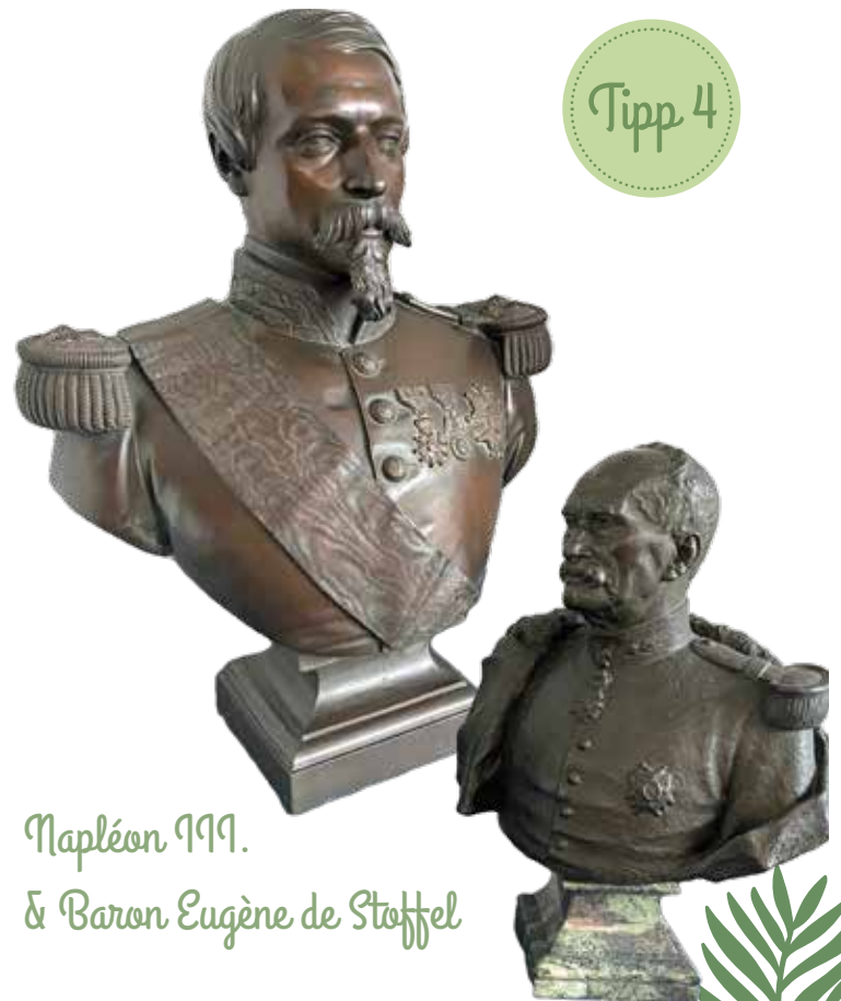
Napoléon III. & Baron Eugène de Stoffel